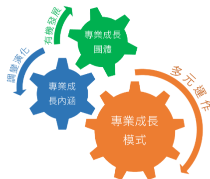
圖 2 教師專業成長系統

依據校務發展計畫，規劃統整性、系統化的教師專業成長作為，聚焦學生學習、教師創新等面向，同時因應 108 新課綱的施行需求，能適時投入素養評量、探究實作、自主學習等專業主題，配合多元的教師成長模式運作，以主題研習、分享交流、國際參訪等發展教師應有專業，茲將教師專業成長系統特性分析如右圖。