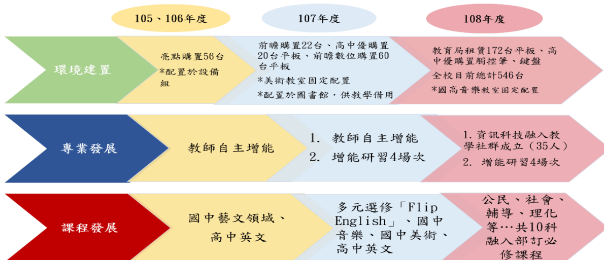
圖 23 行動學習發展歷程

學校透過各項專案計畫建置 546 台平板、教室安裝 Apple TV、觸控筆及鍵盤，教師在增能研習後，增加使用 iPad 教學的頻率，學生使用達 36,459 人次，本校朝向行動學習與智慧教學方向邁進，環境建置與專業發展歷程如下：