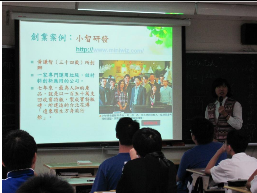
東吳大學-商業概論