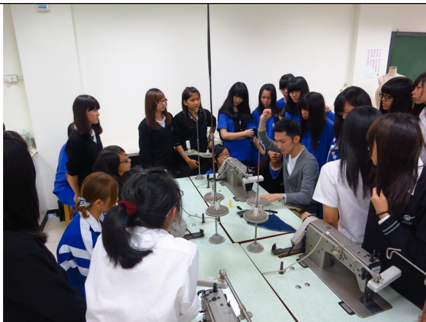
實踐大學-服裝設計