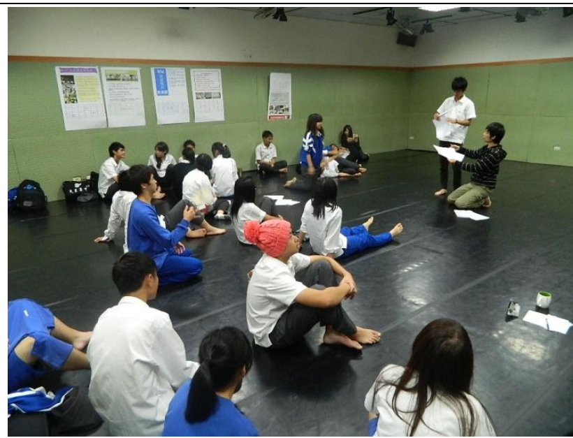
社區劇場工作者-青少年劇場