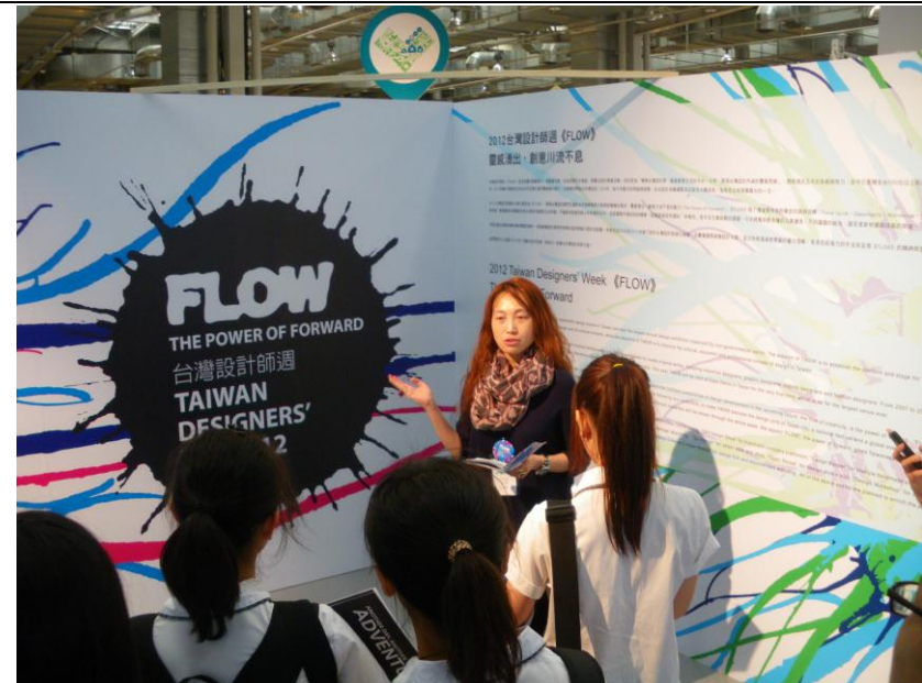
大同大學-設計體驗