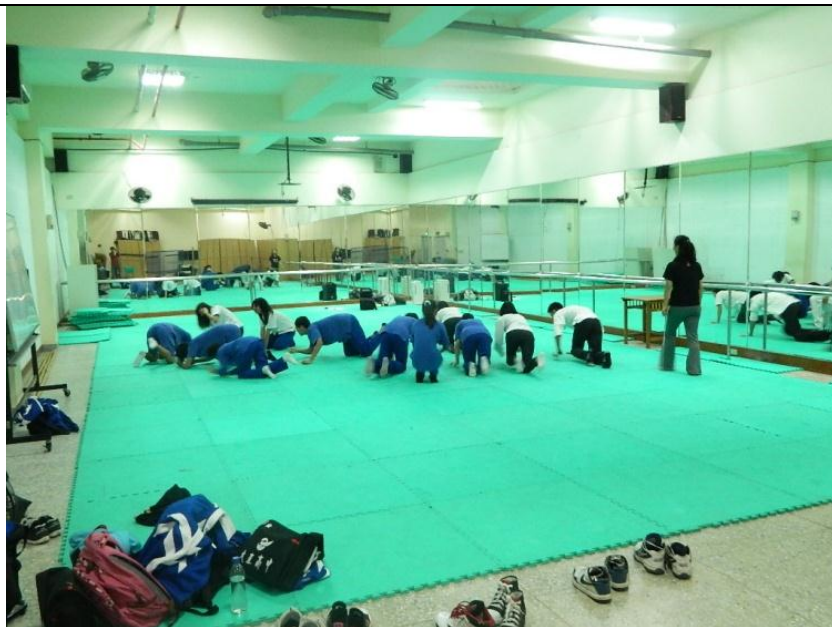
舞蹈生態系創意團隊-肢體律動與多元智慧