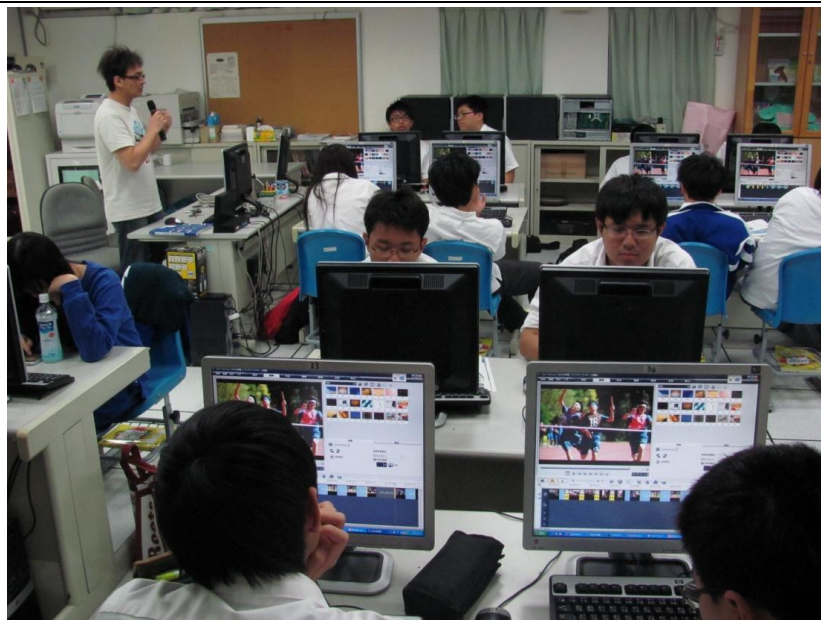
專題研究-多媒體專題