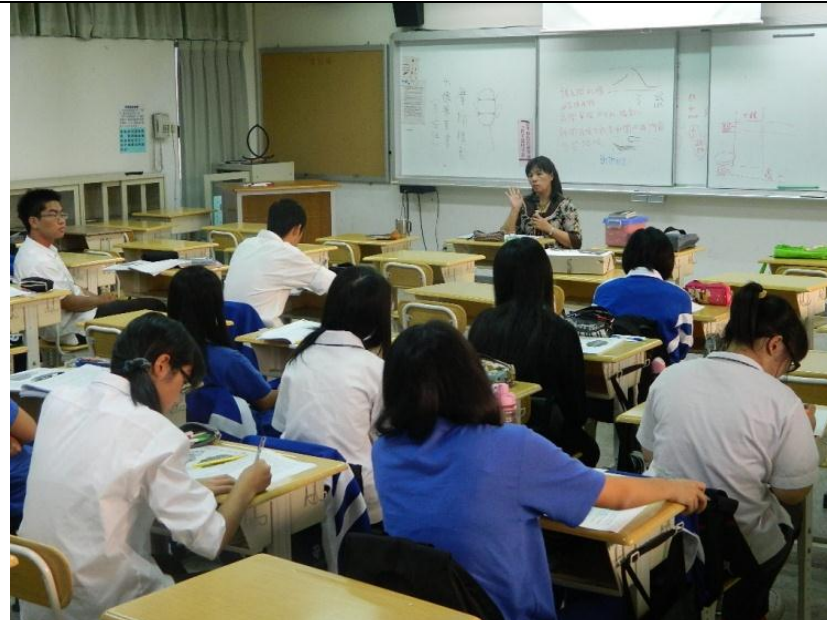
專題研究-國文專題