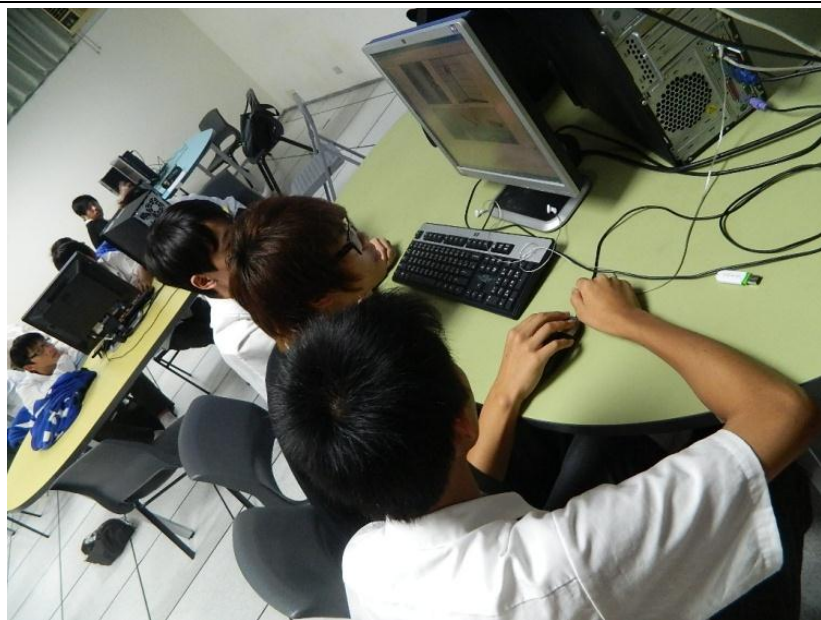
專題研究-物理專題